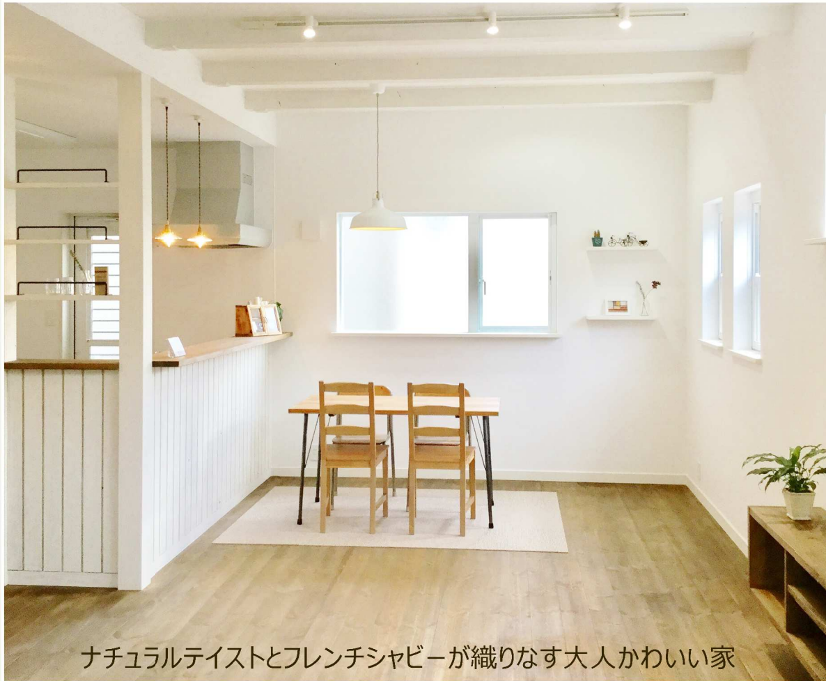
ナチュラルテイストとフレンチシャビーが織りなす大人かわいい家